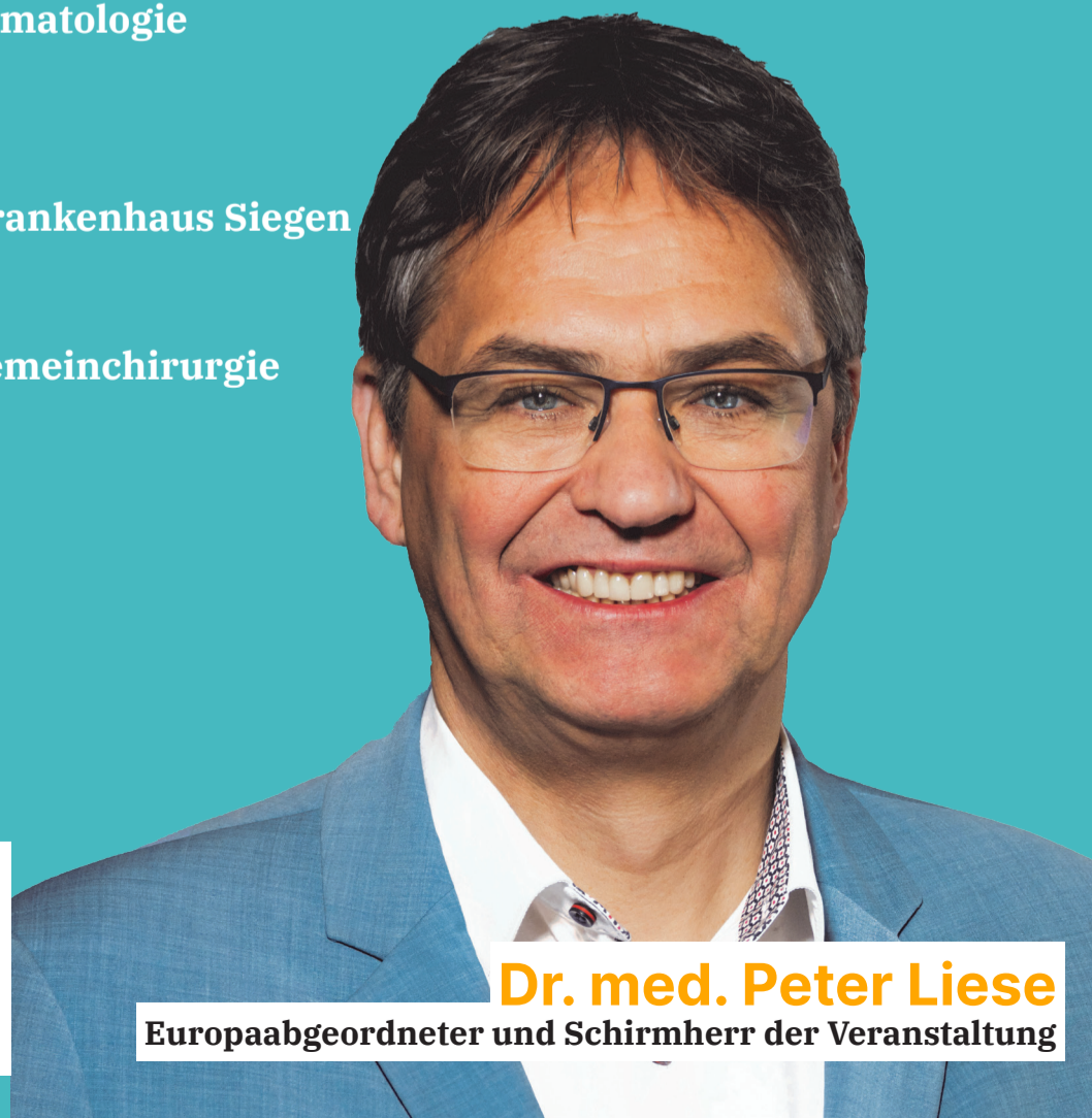
Dr. med. Peter Liese Europaabgeordneter und Schirmherr der Veranstaltung